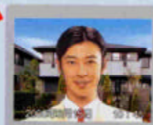
日付と時間も再生します。