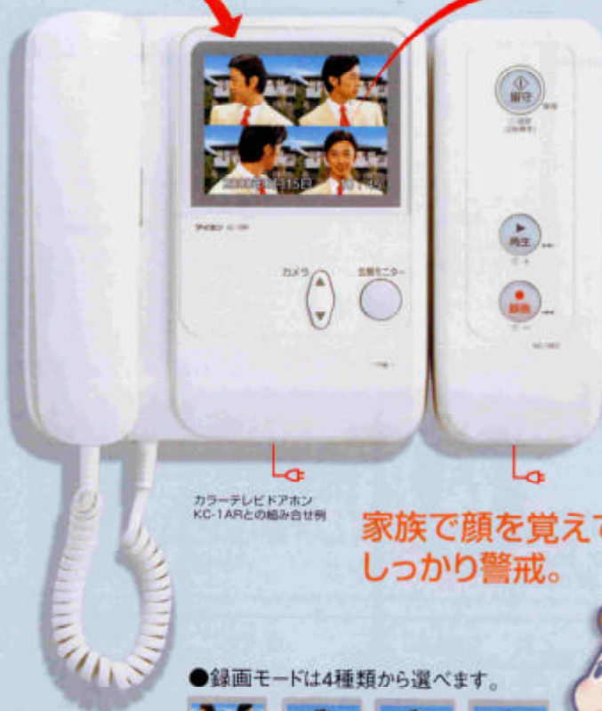
カラーテレビドアホン KC-1ARとの組み合わせ例

ご注意・録画ユニットは直接接続したカメラ付玄関子機の映像だけを録画します。すべてのカメラ付玄関子機の映像を録画するにはカメラ付玄関子機の台数分の録画ユニットが必要です。